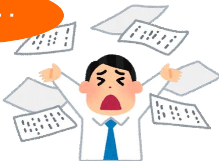
業務改善策の検討