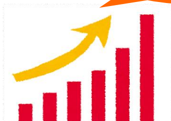
売上拡大策の検討